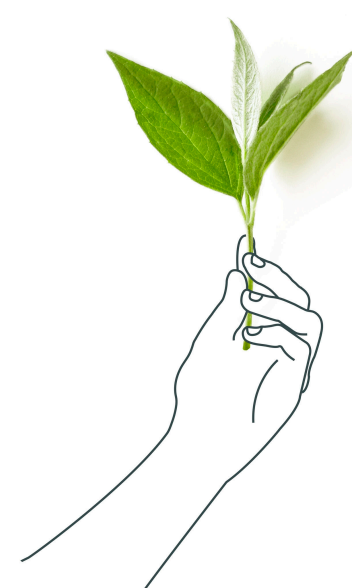
SCHÉMA DE PROMOTION DES ACHATS SOCIALEMENT ET ÉCOLOGIQUEMENT RESPONSABLES